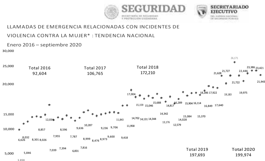
Gráfica 3. Llamadas de emergencia relacionadas con incidentes de violencia contra la mujer (tendencia nacional)