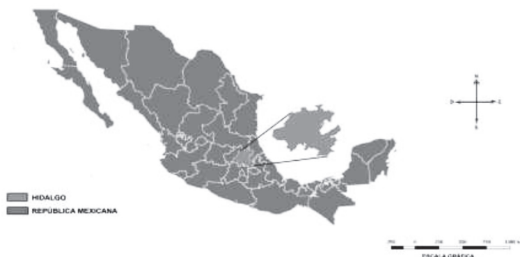
Mapa I. Ubicación del Estado de Hidalgo en México